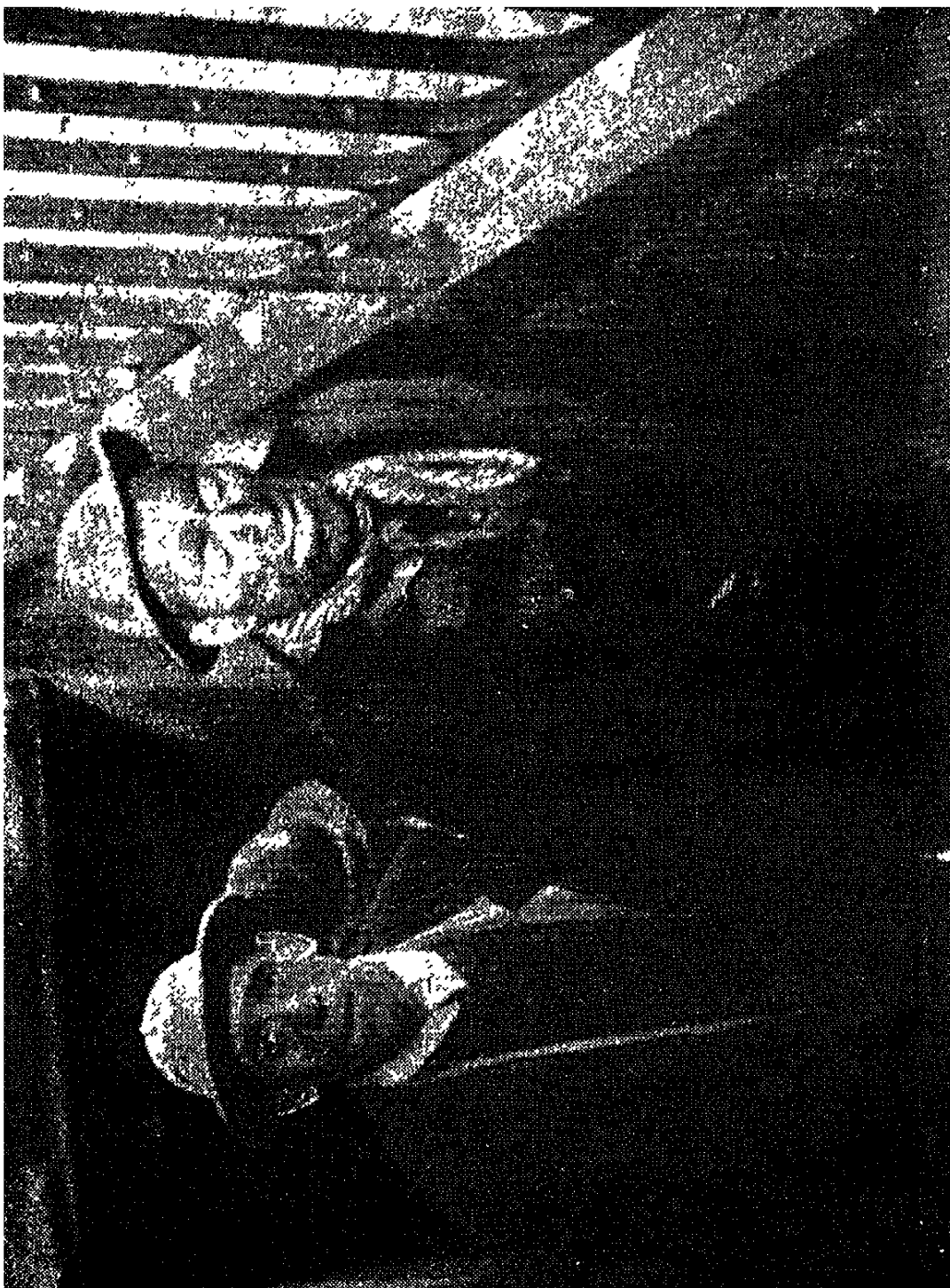
وجوه مغمرة خارجة من الصنع